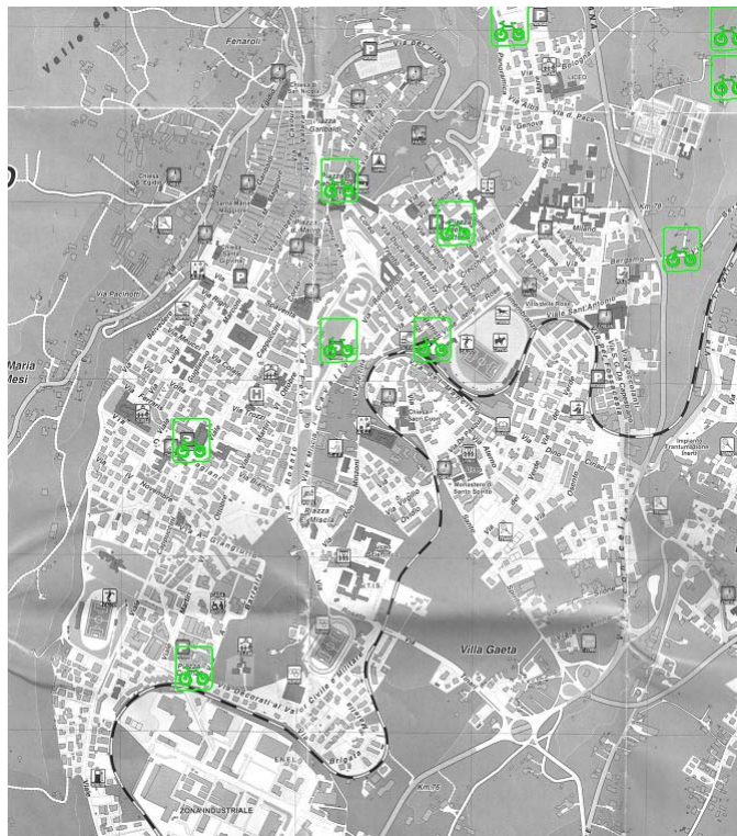
Figura 2: Punti di prelievo biciclette previsti dal progetto Anaxum per il servizio di bike sharing

Viene riportata quindi una corrispondenza di posta elettronica riguardo un progetto denominato “Anaxum” che prevede una ipotesi di percorsi ciclabili e l’istituzione di un servizio di bike sharing, con anche una prima ipotesi di dislocazione dei punti di prelievo delle biciclette (vedi figura seguente).