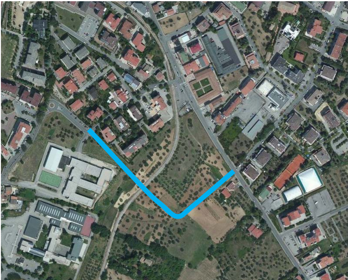
Figura 1: Viabilità prevista dal PRG per l'area in esame

Ritenendo comunque molto importante questa problematica si consiglia di realizzare, previa verifiche tecnico-modellistiche, la viabilità prevista dal vigente Piano Regolatore Generale. Il PRG individua infatti una viabilità di complemento a quest'area, la quale consentirà di collegare la nuova rotatoria davanti al Liceo con Via Santo Spirito, all'altezza dell'intersezione con Via del Verde, e quindi di bypassare Via Virgilio e restituirla al solo traffico locale dei residenti. Nell'immagine seguente si riporta uno schema della nuova viabilità prevista dal PRG.